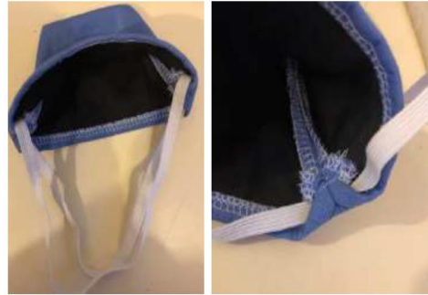
Masque « Bec de canard »