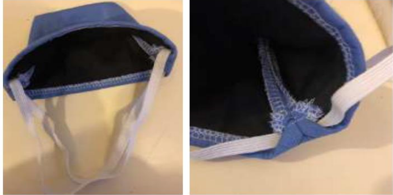
Masque « Bec de canard »