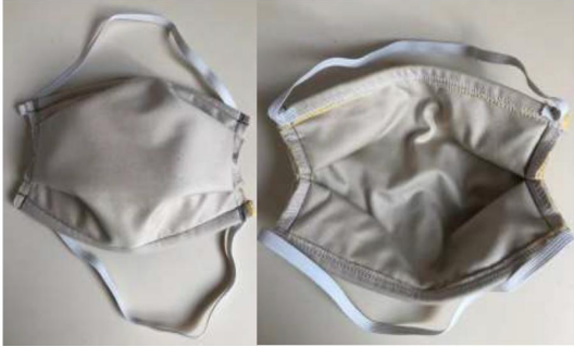
Masque « à plis »